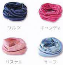
ワルツ キャンディ パステル リーフ

ふわふわシルクの ネックウォーマー 軽くてあたたかいシルクネックウォーマー。シルクの毛を毛並立たせているため、繊細でふわりとした質感が首元を優しく包み込みます。極細の糸を併用しているため目元も軽く、胸中に力パンに収めることができます。 9色のソリッドカラーと4色の柄カラーの中からお好きな色を選んで、重ね付けでのコーディネートにも楽しめます。