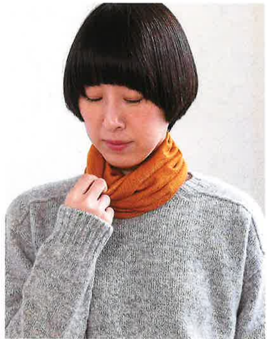
モデル着用/パンプキン